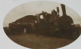
H 40, 1867-1946 (privatbanen VVGJ)

The class H locomotives were smaller than the other types, as they were built to run on the branch lines where the rails were weaker than on the main lines. However, DSB decided to part with them during the years leading up to World War I. The H 40 was sold to the private railway company VVGJ and it was in service till 1946. The H 40 is Denmark's oldest preserved train engine.